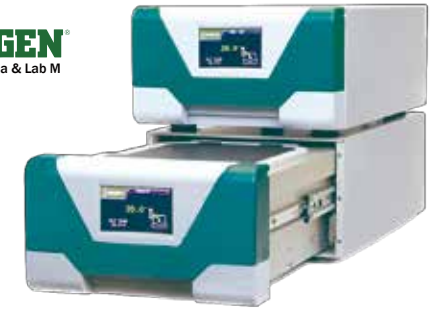
Soleris®細菌光學計數的世界領導者。