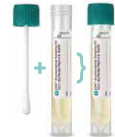
國際標準級·檢體採集棒。