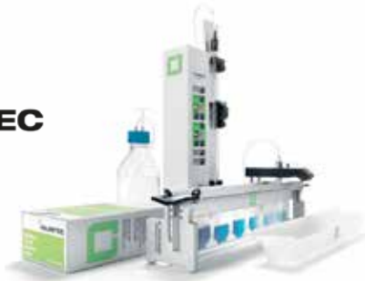
瑞士精密儀器 - 系列稀釋儀的發明家。