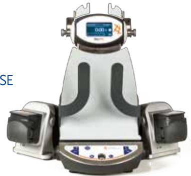
超級 TWIN TURBO · 重量稀釋儀。