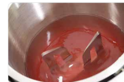
Better homogeneization !