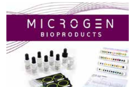
細菌鑑定系列·輕便型·大資料庫套組。