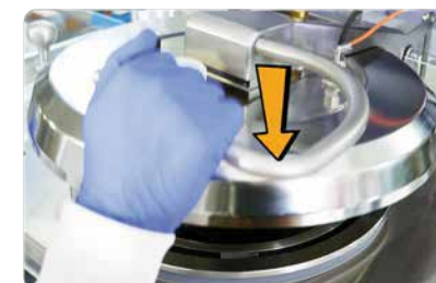
Special Lid :