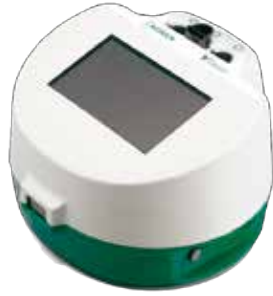
Raptor旗艦型·複合式快檢片·定量判讀機(九合一)。