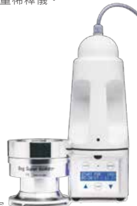
細菌空氣採集器·創始家。