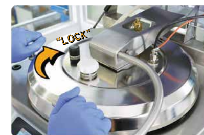
Safety lock with 12 hooks !