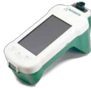
Raptor-solo 複合式快檢片·定量判讀機。